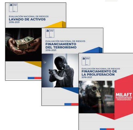
Resultados de la ENR de Lavado de Activos: